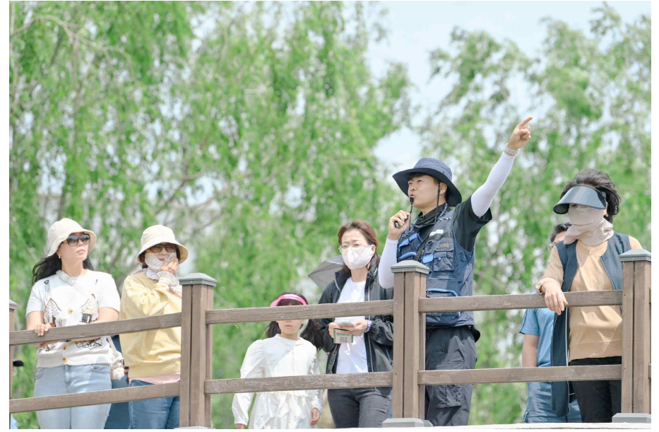
3. 국립세종수목원 해설