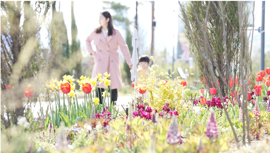
2. 국립세종수목원 꽃길