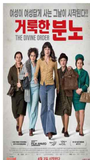
인권위 '25. 2월 상영작