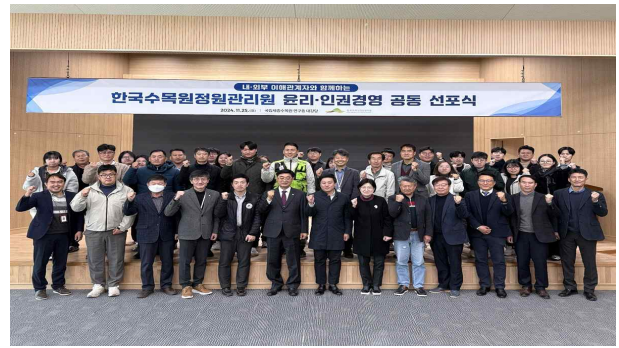
<선포식 및 간담회 기념촬영>