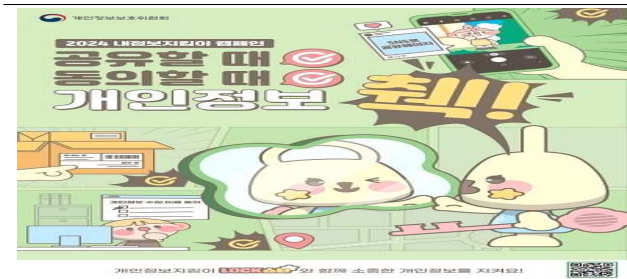
데일리 인권 첵(Check) 예시