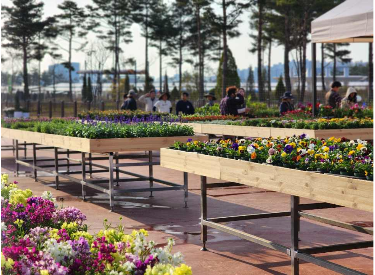
2. 2024년 4월 13일 국립세종수목원에 오픈하는 가든센터 모습