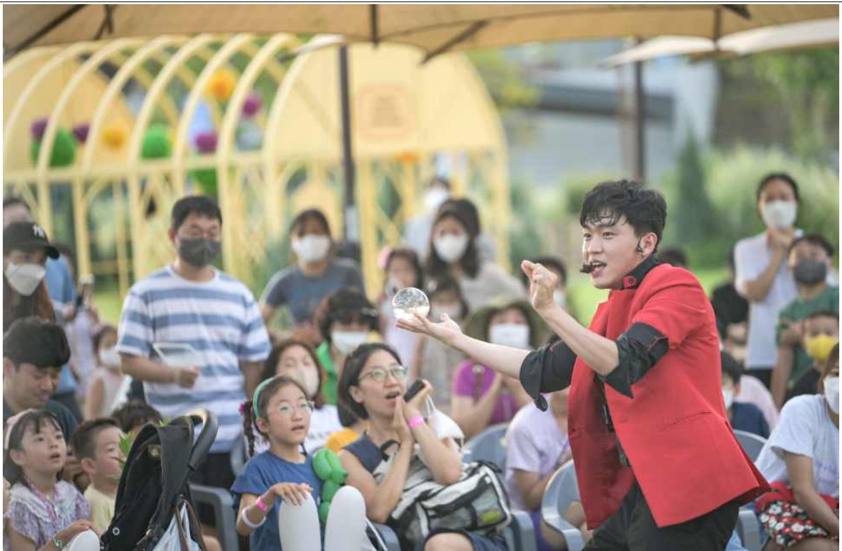
3. 2022년 국립세종수목원 축제마당에서 진행된 마술공연을 관람객들이 즐기고 있다.